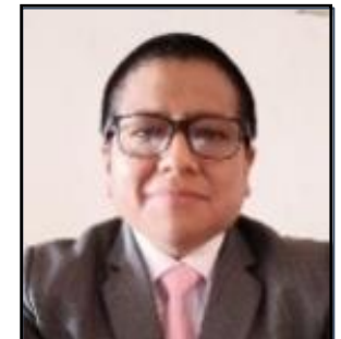
Sec. De Actas y Archivos Quichca Peña Paul CAS - SDVAR "Sede Crillon"